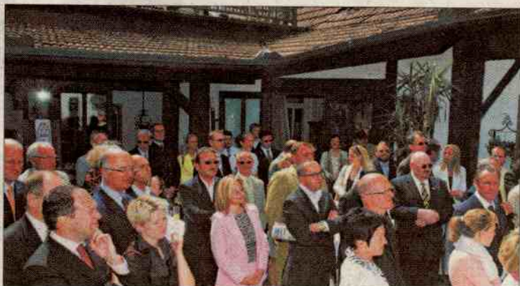
Strahlend: Mit großem Interesse verfolgten die Ehrengäste des NÖ-Geburtstagsfestes von „Heute“ die Festansprachen, die großteils mit viel Humor gewürzt waren