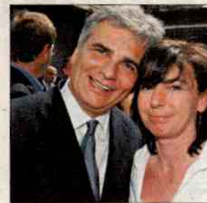
Ein recht seltenes Foto: Wohnbau- und Verkehrsminister rat Werner Faymann und Gattin